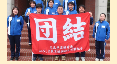
広島農協労連 ひろしま農業協同組合労働組合 3月14日～15日